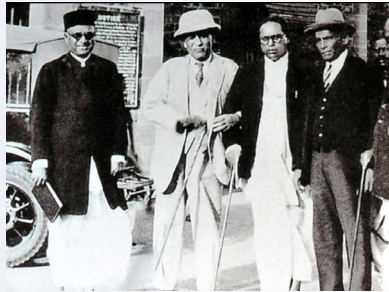
కెల్స్ 5. 13. ఏప్రిల్. ప్రజా జ్యోతి

డా. భీమరావ్ రామ్జీ అంబేద్కర్ (బాబాసాహెబ్ అంబేద్కర్ గారి పిల్లలబడి) 1891 ఏప్రిల్ 14న మహారాష్ట్రలోని మహారా గ్రామంలో ఒక దళిత కుటుంబంలో జన్మించారు. చిన్నప్పటి నుండి కుల వివక్షకు గురైన ఆయన, ఎలాంటి అడ్డంకులు ఎదురైనా ఎల్.ఎల్.బి., డి.ఎస్.సి., బార్-ఆల్-లా వంటి ఉన్నత డిగ్రీలు సాధించారు. కొలంబియా మరియు లండన్ విశ్వవిద్యాలయాల్లో చదువుతూ ఆర్థిక శాస్త్రం, న్యాయం, రాజకీయ శాస్త్రాల్లో నైపుణ్యం పొందారు. భారతదేశంలో మొట్టమొదటి దళిత న్యాయవాదిగా, ఆర్థికవేత్తగా పేరు తెచ్చుకున్నారు ? ఆయన అనుభవాలు కుల వ్యవస్థకు వ్యతిరేకంగా పోరాటాలతో నిండి ఉన్నాయి. 1927లో మహాద్ సత్యాగ్రహంతో దళితులకు బహిష్కరించబడిన పెళ్ళి మైదానం, ఛౌదర్ ట్యాంక్ లో పానీయ హక్కు కోసం పోరాడారు. 1930లో కాలా రామ్ బెంపుల్ ఎంట్రి సత్యాగ్రహం, 1932 పూణా ఒప్పందంతో దళితులకు ప్రత్యేక రాయబారుల హక్కు సాధించారు. పొయ్ గౌడా ఆలయ ప్రవేశం, మర్యాదా కాంత్ హత్య కేసుల్లో న్యాయ పోరాటాలు ఆయన దైర్యానికి, న్యాయానికి చిహ్నాలు. రౌండ్ టేబుల్ కాన్ఫరెన్స్ లో భారతీయ ప్రాతినిధ్యం చేసి, దళిత హక్కులకు పోరాడారు ?