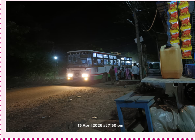
13 April 2026 at 7:30 pm

రాయికోడ్ ఏప్రిల్ 13 (ప్రజాజ్యోతి): మండల కేంద్రంలోని బస్టాండ్ లోకి ఆర్టీసీ బస్సులు రాకుండా మెయిన్ రోడ్ పై కొందరు డ్రైవర్లు నిర్లక్ష్యంతో వెళ్లిపోతుండటంతో ప్రయాణికులు తీవ్ర ఇబ్బందులు పడుతున్నారు. బస్టాండ్ వద్ద బస్సుల కోసం ఎదురుచూస్తున్న ప్రయాణికులు, బస్సులు లోపలికి రాకపోవడంతో అవి వెళ్తున్న మెయిన్ రోడ్ వరకు పరుగులు తీస్తూ కనిపించిన దృశ్యం ఇది. ఆర్టీసీ డ్రైవర్ల నిర్లక్ష్యంతో ప్రత్యేకంగా ఉదయం, సాయంత్రం రద్దీ సమయాల్లో ఈ సమస్య మరింత ఎక్కువగా కనిపిస్తుందని ప్రయాణికులు తెలిపారు. విద్యార్థులు, ఉద్యోగులు, గ్రామాల నుంచి వచ్చే ప్రజలు బస్టాండ్ వేచి చూడగా రాకపోవడంతో హడావుడిగా రోడ్డుపైకి పరుగులు తీసి ఎక్కాల్సిన పరిస్థితి ఏర్పడుతుందని అన్నారు. ప్రయాణికుల ప్రకారం, ఈ పరిస్థితి కారణంగా ప్రమాదాలు జరిగే అవకాశాలు కూడా ఉన్నాయని ఆందోళన వ్యక్తం చేస్తున్నారు. ముఖ్యంగా వృద్ధులు, మహిళలు, చిన్నపిల్లలు రోడ్డుపైకి వెళ్లి బస్సులు ఎక్కడం చాలా కష్టంగా మారిందని చెప్పారు. అలాగే బస్టాండ్ పరిసరాల్లోని చిన్న వ్యాపారులు కూడా నష్టపోతున్నామని ఆవేదన వ్యక్తం చేశారు. ఈ సమస్యపై సంబంధిత అధికారులు వెంటనే స్పందించి, అన్ని ఆర్టీసీ బస్సులు తప్పనిసరిగా బస్టాండ్ లోకి రావాలని, ప్రయాణికులకు ఎటువంటి ఇబ్బందులు లేకుండా చర్యలు తీసుకోవాలని ప్రజలు డిమాండ్ చేస్తున్నారు.