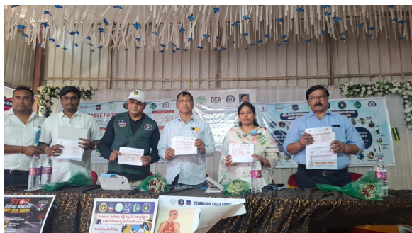
అసిఫాబాద్ ఏప్రిల్ 11 ప్రజా జ్యోతి:

-డ్రగ్స్, గంజాయి, కల్తీ కల్లు నియంత్రణపై ప్రత్యేక అవగాహన కార్యక్రమం