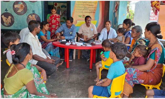
ఆసిఫాబాద్ ఏప్రిల్ 11 ప్రజా జ్యోతి:

ప్రజాపాలన ప్రగతి ప్రణాళిక ఫేజ్-2లో భాగంగా తేజాపూర్ అంగన్వాడీ కేంద్రంలో ఆరోగ్య అవగాహన సదస్సు నిర్వహించారు.