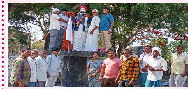
అసిఫాబాద్ ఏప్రిల్ 11 ప్రజా జ్యోతి :