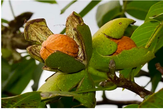
కల్వ 5. 9. ఏప్రిల్.. ప్రజా జ్యోతి:

యువతి యువకులకు ఇదొక మంచి అద్భుత దివ్య ఔషధం