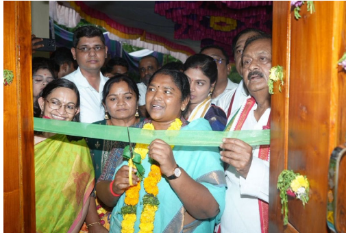
ఈ కార్యక్రమంలో జిల్లా కలెక్టర్, జిల్లా ఎస్పీ, అదనపు కలెక్టర్లు, జిల్లా మహిళా శిశు సంక్షేమ అధికారి, వివిధ శాఖల అధికారులు, ప్రజాప్రతినిధులు పాల్గొన్నారు.

మహిళల భద్రత, సాధికారతకు ప్రభుత్వం కట్టుబడి ఉంది: మంత్రి మహిళల భద్రత, సాధికారతకు రాష్ట్ర ప్రభుత్వం పెద్దపీట వేస్తోందిని రాష్ట్ర పంచాయతీరాజ్, గ్రామీణాభివృద్ధి, మహిళా శిశు సంక్షేమ శాఖ మంత్రి శ్రీమతి దనసరి అనసూయ (సీతక్క) తెలిపారు. మంగళవారం సాయంత్రం కామారెడ్డి జిల్లా కేంద్రంలో నూతనంగా ఏర్పాటు చేసిన 'సఖి' వన్ స్టాప్ సెంటర్ ను మంత్రి సీతక్క ప్రారంభించారు. ఈ సందర్భంగా మంత్రి మాట్లాడుతూ, హింసకు గురైన మహిళలకు ఒకే చోట వైద్య, పోలీసు, న్యాయ, కౌన్సెలింగ్ సేవలు అందించడమే 'సఖి' సెంటర్ ముఖ్య ఉద్దేశమని తెలిపారు. బాధిత మహిళలు భయపడకుండా ధైర్యంగా ముందుకు వచ్చి ఈ సెంటర్ సేవలను వినియోగించుకోవాలని పిలుపునిచ్చారు. మహిళలపై జరిగే అత్యాచారాలు, గృహహింస కేసుల్లో వెంటనే స్పందించి బాధితులకు న్యాయం జరిగేలా చూడాలని పోలీసు, సంబంధిత శాఖల అధికారులను ఆదేశించారు. మహిళా సంఘాలను బలోపేతం చేసి ఆర్థిక స్వావలంబన దిశగా ప్రభుత్వం చర్యలు తీసుకుంటోందని తెలిపారు.