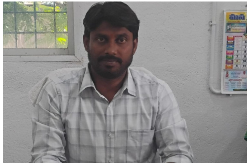
ప్రశ్నలకు సమాధానాలు ఇచ్చి, ప్రీవీవ్ డ్వారా చెక్ చేసి నమోదు చేయండి. నమోదు చేసిన తరువాత హెచ్ తో ప్రారంభమయ్యే 11 అంకెల ఎన్ఇ బడి వస్తుంది, దాన్ని ఫ్రీన్ షాట్ లేదా నోట్ చేసుకుని భద్రపరచండి.