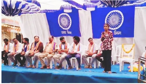
తెలిపారు. భారతదేశానికి గొప్ప రాజ్యాంగాన్ని అందించిన మహనీయుడిగా ఆయన సేవలను కొనియాడారు. ఈ కార్యక్రమంలో బీర్హార్ గ్రామ ప్రజలు, అంబేద్కర్ యువజన సంఘం నాయకులు పెద్ద సంఖ్యలో పాల్గొని వేడుకలను విజయవంతం చేశారు.