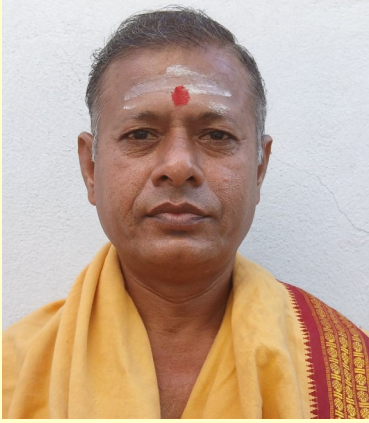
ప్రజా జ్యోతి, బాల్కొండ :

నిమిషాంబ దేవి చరిత్ర బాల్కొండ లో కొలువై ఉన్న శ్రీ నిమిషాంబ దేవి ఆలయం - భారత దేశంలో 4వ ఆలయంగా ప్రసిద్ధి.