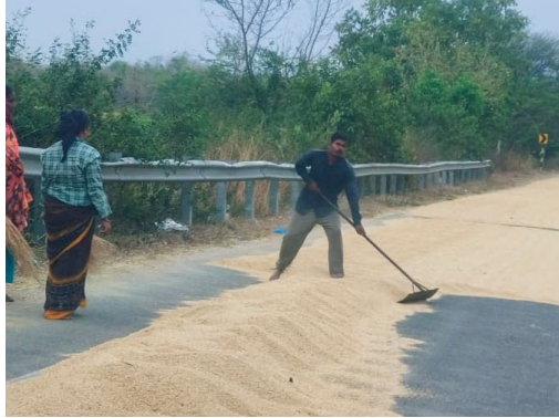
ఉంది. రోడ్డు పక్కన ఆరబోసిన వరి ధాన్యం సైతం కొట్టాకొని పోయి చేతికందకుండా పకనురుగయ్యి పరిస్థితి కూడా ఉంది. దీంతో రైతులను మేఘమా.. కురవకే.. అంటూ ఆకాశం వైపు చూస్తున్నారు.

ఏ క్షణాన కమ్మకున్న మేఘాలు వడగండ్ల వానను కురిపిస్తాయోనని దిగులు చెందుతున్నారు. ఒకవేళ భారీ వర్షాలు కురిస్తే చేతికి వచ్చిన వరి, మొక్కజొన్న, సువ్వు పంటలు నెల రాలిపోయే ప్రమాదం ఉంది. ఒక్కసారి ఎండలతో మండిపోయిన వాతావరణంలో రెండు రోజులుగా వాతావరణం మేఘావృతం కావడంతో వరి కోత యంత్రాలకు మార్కెట్లో డిమాండ్ విపరీతంగా పెరిగింది. సమయానికి వరి కోత యంత్రాలు దొరకక రైతులు బిక్కుబిక్కుమంటున్నారు. ఇదిలా ఉండగా ఓ వక్క రైతులను ప్రకృతి కలవర పెడుతుంటే.. మరోవక్క ప్రభుత్వం నుండి రావలసిన రైతు భరోసా డబ్బులు చేతికందక రైతుల పరిస్థితి దయనీయంగా మారింది. దఫలు దఫలుగా రైతుల ఖాతాల్లోనికి భరోసా డబ్బులు జమ చేస్తున్నామని ఓ వక్క ప్రభుత్వం, మరోవక్క అధికారులు వెల్లడిస్తున్నప్పటికీని ఖాతాల్లోకి వచ్చే డబ్బులపై స్పష్టత లేక రైతులు ఆయోమయానికి గురవుతున్నారు. దీంతోపాటు కొనుగోలు కేంద్రాల్లో అధికారుల నిర్లక్ష్యం కూడా రైతుల పాలిటా వెళ్లాలి మారింది. అలాగే కల్లాల్లో దార పోసిన వరి ధాన్యం కుప్పలు.. భారీ వర్షం పడితే నానిపోయే ప్రమాదం