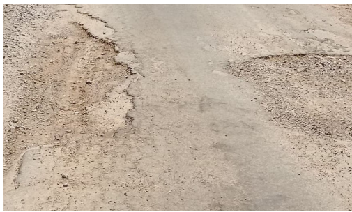
వదిలేశారు రెండు గ్రామాల ప్రజలకు ఈ రోడ్డు శాపంగా మారింది నేటికీ ఆర్ అండ్ బి అధికారులు కంకర పోసి వదిలేసారే తప్ప పూర్తిస్థాయిలో రోడ్డు మరమ్మత్తులు చేపట్టలేదు. అధికారులు స్పందించి రెండు గ్రామాల ప్రజలకు రోడ్డు మార్గం కల్పించే విధంగా కంకర పోసి వదిలేసిన రోడ్డుకు మరమ్మత్తులు చేపట్టాలని మొండిపడుతున్నారు.

గత సంవత్సరం ఆగస్టు నెలలో కురిసిన భారీ వర్షాలకు సదాశివనగర్ మండలం లోని మర్కల్, తీర్థాస్ పల్లి గ్రామాల రోడ్డు గుంతలు పడగా రోడ్డు మరమ్మత్తులు చేపట్టేందుకు కంకర పోసారు వదిలేశారు కానీ నేటికీ రోడ్డు మరమ్మత్తులు చేపట్టకపోగా రెండు గ్రామాల ప్రజలు ఇబ్బంది పడుతున్నారు. గ్రామాల ప్రజలే కాకుండా రామారెడ్డి మండలం ఇతర గ్రామాలకు వెళ్లే వాహన దారులు సైతం ఇదేమి రోడ్డు అంటూ మొండిపడుతున్నారు. గ్రామాల ప్రజలు ఊళ్ళ కేంద్రానికి పలు పనులపై వెళ్లాలంటే రోడ్డు మార్గం సరిగ్గా లేక అవస్థలు పడుతున్నారు. మరమ్మత్తుల కోసం కంకర పోశారు వదిలేశారు. ఆర్ అండ్ బి అధికారులు నామమాత్రంగా పర్యవేక్షణ చేసి కంకర పోసి మధ్యలోనే