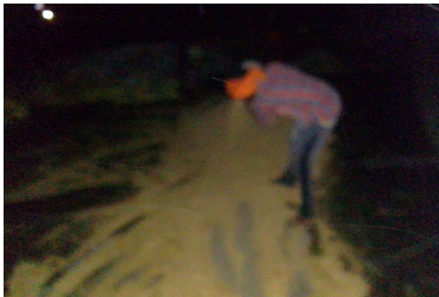
రెంజల్, ఏప్రిల్ 19(ప్రజాజ్యోతి):

పట్టించుకొని అధికారులు. ఆందోళన చెందుతున్న రైతన్నలు