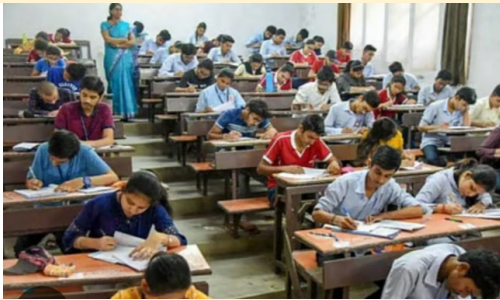
సదాశివనగర్, ఏప్రిల్ 19 (ప్రజాజ్యోతి)