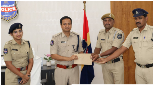
కామారెడ్డి ప్రతినిధి ఏప్రిల్ 18 (ప్రజాజ్యోతి)