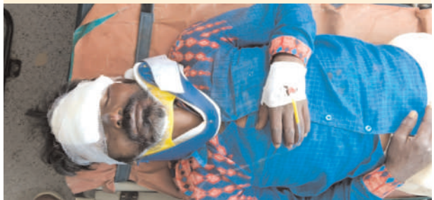
ప్రజా జ్యోతి. బోధన్ ఏప్రిల్ 06 :