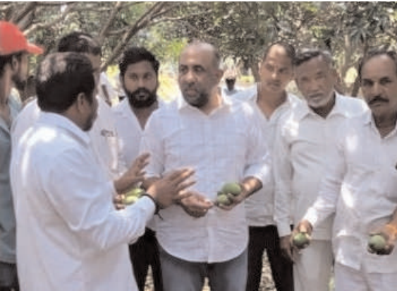
ప్రజా జ్యోతి. బోధన్ మండలం. ఏప్రిల్ 5...

నిజామాబాద్ జిల్లా బోధన్ నియోజకవర్గ పరిధిలోని పంటలను పరిశీలించిన మాజీ ఎమ్మెల్యే షకీల్ మరియు బి ఆర్ఎస్ పార్టీ నాయకులు కార్యకర్తలు పెద్ద ఎత్తున వెళ్లి పంటలను పరిశీలించడం జరిగింది. సాలూర మండలం, హుస్సేన్ ఖాజాపూర్ మండల గ్రామాలలో పరి మామిడి మొక్కజొన్న పంటలు భారీగా నష్టపోయాయి అకాల వర్షంతో రైతులను నిండా ముంచేసింది. కోత దశలోకి వచ్చిన వరి పంట మొత్తం నెలకొరిగింది. వరి రైతులు మాకు ఊరి మిగిలింది అని అంటున్నారు ఆరుగాలం పండించిన పంట చేతికి రాకుండా పోయిందని రైతులు ఆత్మహత్య చేసుకుంటామని అంటున్నారని తక్షణమే ప్రభుత్వ అధికారులు