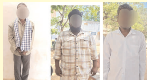
కామారెడ్డి ప్రతినిధి ఏప్రిల్ 02.