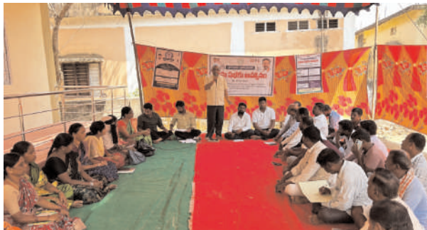
నాగిరెడ్డిపేట్, ఏప్రిల్ 2 (ప్రజాజ్యోతి);

నాగిరెడ్డిపేట్ మండలంలోని గ్రామపంచాయతీల్లో 99 రోజుల ప్రజా ప్రణాళికలో భాగంగా గురువారం గ్రామసభలు నిర్వహించారు. గ్రామాలకు రెండున్నర ఏళ్లలో ప్రభుత్వం అమలు చేసిన సంక్షేమ పథకాలతో ముద్రించిన కరపత్రాలను సభకు హాజరైన ప్రజలకు అందజేశారు. మండలంలోని 27 గ్రామ పంచాయతీల్లో గ్రామ సర్పంచ్ ల అధ్యక్షతన, ప్రత్యేక అధికారుల ఆధ్వర్యంలో ఈ గ్రామ సభలు నిర్వహించారు. కాంగ్రెస్ ప్రజా ప్రభుత్వం చేపడుతున్న వివిధ ప్రభుత్వ ప్రజా సంక్షేమ పథకాలను గ్రామ సభల్లో అధికారులు ప్రజలకు వివరించారు. ప్రభుత్వం చేపడుతున్న సంక్షేమ పథకాలను ప్రజలు సద్వినియోగం చేసుకోవాలని వారు కోరారు. ఆయా గ్రామాల్లో నెలకొన్న సమస్యలను ప్రజలు అధికారుల దృష్టికి తీసుకెళ్లారు. గ్రామ సమస్యల పైన చర్చించారు. సమస్యల