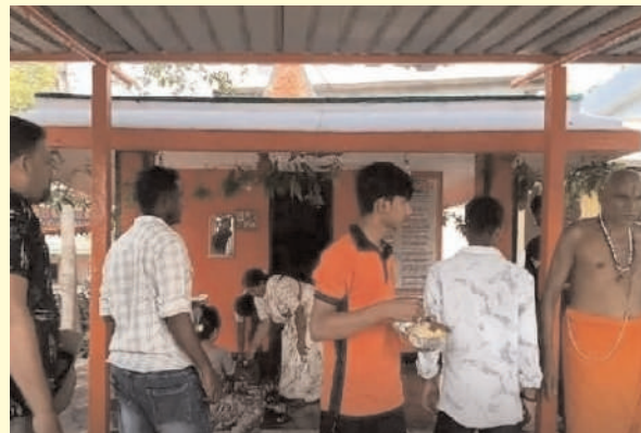
గాంధారి, ఏప్రిల్ 02 (ప్రజాజ్యోతి)

గాంధారి మండల కేంద్రంలో పాటు పరిసర గ్రామాలలో హనుమాన్ ఆలయాలు గురువారం భక్తులతో కిక్కిరిసిపోయాయి. హనుమాన్ జయంతి సందర్భంగా ఆలయ ప్రాంగణాలు భక్తి భావంతో కళకళలాడాయి. “జై హనుమాన్” నినాదాలతో మండలమంతా ఆధ్యాత్మిక వాతావరణం నెలకొంది. హనుమాన్ దీక్షలు స్వీకరించిన భక్తులు తెల్లవారుజాము నుంచే ఆలయాలకు చేరుకుని ప్రత్యేక పూజలు నిర్వహించారు. అంజనేవుడుడికి అభిషేకాలు, అర్చనలు నిర్వహించి మొక్కులు తీర్చుకున్నారు. భారీ సంఖ్యలో భక్తులు తరలిరావడంతో ఆలయాలన్నీ సందడిగా మారాయి. పూజా కార్యక్రమాల అనంతరం వివిధ ఆలయ కమిటీల ఆధ్వర్యంలో అన్నదాన కార్యక్రమాలు నిర్వహించారు. భక్తులకు ఎటువంటి ఇబ్బందులు కలగకుండా కమిటీ సభ్యులు విస్తృత ఏర్పాట్లు చేశారు. ఇదిలా ఉండగా, మండలంలోని సీతాయిపల్లి గ్రామంలో రామసేన ఆధ్వర్యంలో హనుమాన్ జయంతి వేడుకలను ఘనంగా నిర్వహించారు. ఉదయం నుంచి భక్తులు ఆలయంలో పూజలు నిర్వహించి మొక్కులు చెల్లించుకున్నారు. అనంతరం గ్రామంలో భారీ ర్యాలీ నిర్వహించి హనుమాన్ విగ్రహాన్ని ఊరేగించారు. భక్తులు నృత్యాలు చేస్తూ పాల్గొనడంతో గ్రామం ఉత్సాహభరితంగా మారింది. ఈ కార్యక్రమంలో భక్తులు, గ్రామస్తులు పెద్ద సంఖ్యలో పాల్గొన్నారు.