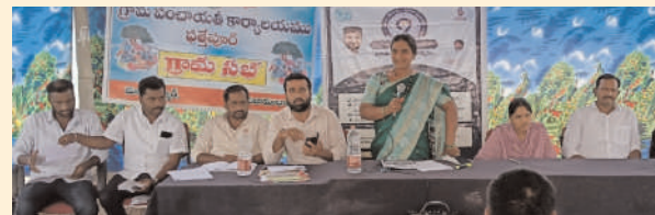
ఆర్యూర్, ఏప్రిల్ 2 ప్రజాజ్యోతి