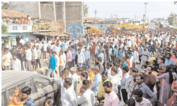
రామారెడ్డి ఏప్రిల్ 2 (ప్రజా జ్యోతి)

రామారెడ్డి మండల కేంద్రంలోని అత్యంత పవిత్రమైన పుణ్యక్షేత్రం శ్రీ సీతారామచంద్ర రాజరాజేశ్వర ఉభయ ఆలయాల బ్రహ్మోత్సవాలు అంగరంగ వైభవంగా గత 15 రోజులుగా ప్రతిరోజు ఒక్కొక్క అవతారంపై శ్రీ సీతారామచంద్ర రాజరాజేశ్వర ఉత్సవ విగ్రహాలను ప్రధాన వీధుల గుండా భక్తులకు దర్శనమిస్తూ ఆలయంలో ప్రతిరోజు ఘనంగా పూజలు జరుపుతూ బ్రహ్మోత్సవాలలో భాగంగా చివరి రోజుగా ఉభయ ఆలయాల రథోత్సవాలను ఘనంగా నిర్వహించడం జరిగింది. ఈ రకరకాల పూలమాలలతో ముస్తాబ్ చేసిన ఉభయ రాతలు, రథోత్సవాలలో భాగంగా ఆంజనేయ స్వామి జన్మదినం సందర్భంగా స్వామివారిని ఊరేగింపు తో పాటు మంగళ హారతులతో, భజన కార్యక్రమాలతో, ఉదయం సూర్యోదయం కంటే ముందు. ఉభయ ఆలయాల ఉత్సవమూర్తులను కన్నుల విందుగా గ్రామంలోని రాతలగైన్ నుండి రామారెడ్డి సబ్ స్టేషన్ వరకు వేలాదిమంది భక్తులతో భారీ బరువుతో కూడిన రథోత్సవాలను జై జై శ్రీరామ్, సీతారామచంద్ర స్వామి గోవిందా, రాజరాజేశ్వర స్వామి గోవిందా అంటూ ప్రజలు యువకులు, ఉత్సాహంతో స్వామివారి రథోత్సవాన్ని లాగడం జరిగింది. ఈ సందర్భంగా ఫ్రెండ్స్ యూత్ అసోసియేషన్ ఆధ్వర్యంలో ప్రజలకు పులిహోర అల్పాహారాన్ని అందజేయడం జరిగింది. ఉత్సవమూర్తులను రథోత్సవం తర్వాత పల్లకి సేవలో అందంగా ముస్తాబు చేసి ఉభయ స్వామివారు లను భాషా భజనంతో డిజి సౌండ్ సప్పుడుతో యువకుల ఆటపాటలతో ఘనంగా రథోత్సవం నుండి ఆలయం కు పల్లకి సేవతో భుజాలపై మోసుకుంటూ తీసుకెళ్లడం జరిగింది. మార్గమధ్యలో స్వామివారికి మంగళ హారతులు ఘనంగా అందించారు. తదుపరి భక్తుల సౌకర్యార్థం ఆలయ ప్రాంగణంలోని కళ్యాణ మండప వేదికలో మహా