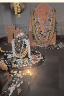
బోధన్ ప్రజా జ్యోతి