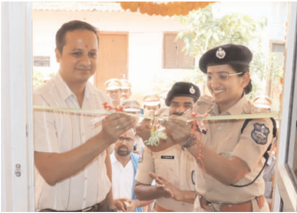
కామారెడ్డి ప్రతినిధి ఏప్రిల్ 01. (ప్రజాజ్యోతి)