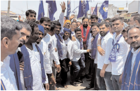
నాగిరెడ్డిపేట, ఏప్రిల్ 14 (ప్రజాజ్యోతి):