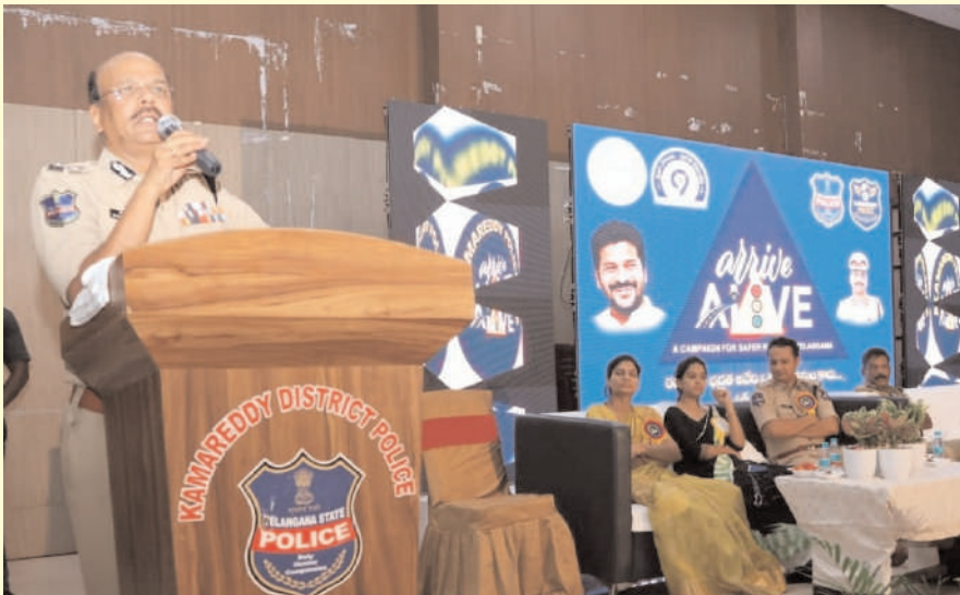
కామారెడ్డి ప్రతినీధి ఏప్రిల్ 14. (ప్రజాజ్యోతి)

- తెలంగాణ డీజీపీ బి. శివధర్ రెడ్డి పిలుపు