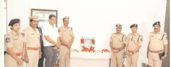
కామారెడ్డి ప్రతినిధి ఏప్రిల్ 14.