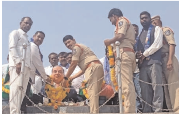
సదాశివనగర్, ఏప్రిల్ 14 (ప్రజాజ్యోతి)

సదాశివనగర్ మండల కేంద్రంలో అంబేద్కర్ 135 వ జన్మదిన వేడుకలు ఘనంగా నిర్వహణ ప్రజాప్రతినిధులు, ఉన్నతాధికారులు, నేతలు హాజరు