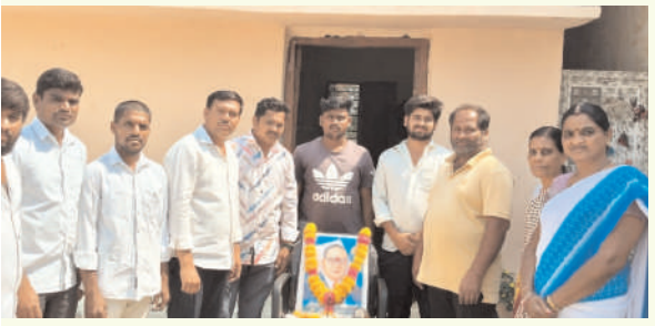
కామారెడ్డి రూరల్ 14 ఏప్రిల్ ప్రజా జ్యోతి