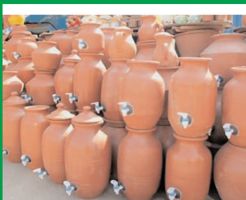
కామారెడ్డి ఏప్రిల్ 14 (ప్రజా జ్యోతి)

రోజు రోజుకు ముదురుతున్న భాసుది ఎండ తీవ్రతకు తట్టుకోలేక ప్రజలు వెలవెలబోతున్నారు. ఈ యొక్క వేసవి దాహార్థిని తీర్చుకోవడానికి కాస్త చల్లటి నీరు తాగి దాహార్థిని తీర్చుకుందాం అంటే ప్రిడ్డ్ వాటర్ ఆరోగ్యానికి అంత మంచిది కాదని ఆరోగ్య నిపుణులు చెప్తున్నారు. పేదవాడి ప్రిడ్డ్ కుండా..! నీరు తాగడం వలన ఎన్ని ఆరోగ్య ప్రయోజనాలో ప్రిడ్డ్ వాడటం వల్ల పర్యావరణానికి హానికరం ఎందుకంటే దీని నుంచి వెలువడే వాయువులు వాతావరణంలో