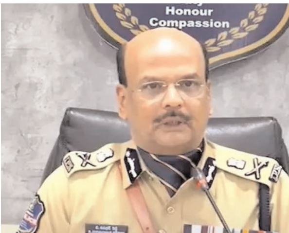
జిల్లా కన్వెంట్లో నిర్మించిన పోలీస్ హౌసింగ్ కార్పొరేషన్ డీజీపీ ప్రారంభించారు. ఆసిఫాబాద్ జిల్లా రెజ్వెన్లో పోలీసుల ఆధ్వర్యంలో నిర్మించిన లైబ్రరీని ప్రారంభించడంతోపాటు పలు అభివృద్ధి పనులకు శంకుస్థాపనలు చేశారు