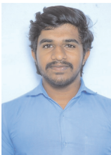
సీఈసీ ద్వితీయ సంవత్సరం ఇలియాజ్ 716/1000