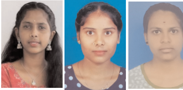
దీక్షాజలో డి. కీర్తన

వీజల్ పెంట శ్రీ వందన (453/470) అగ్రస్థానంలో నిలవగా, గుర్రపు నికీత (437), చంద్రప్రల్లి పూజిత (433), పులి సీత శ్రీ (403) ప్రతిభ కనబరిచారు.