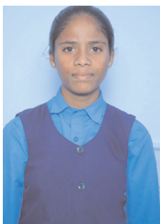
బైపీసీ ద్వితీయ సంవత్సరం సంగీతా 878/1000