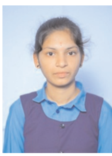
ఎంపీసీ మొదటి సంవత్సరం కుమ్మరి కావ్య 438/470