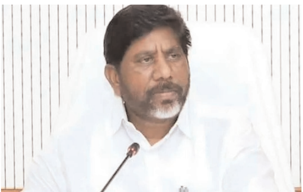
ఓబీసీ స్టూడెంట్స్ అసోసియేషన్ ప్రతినిధుల బృందంతో భట్టివిక్రమారావు సమావేశమయ్యారు.