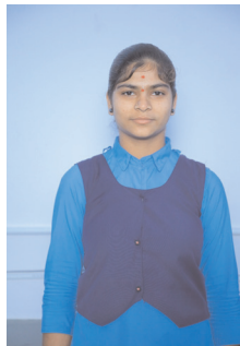
ఎంపీసీ ద్వితీయ సంవత్సరం కాట్రోత్ హారిక 970/1000