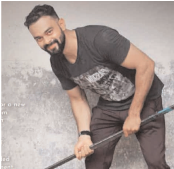
మరియు ఫిట్ నెస్ కార్యకలాపాలను ప్రజలు అభిమానులతో ఫేస్ బుక్ ఇంస్టాగ్రామ్ వాట్సాప్ లలో పంచుకుంటారు.