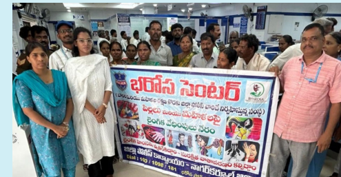
నాగర్ కర్నూల్ : ఏప్రిల్ 29 (ప్రజా జ్యోతి)