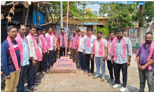
చేస్తామని పేర్కొన్నారు. ఈ వేడుకలు కార్యకర్తల్లో కొత్త ఉత్సాహాన్ని నింపగా, రాబోయే కార్యక్రమాలకు మరింత బలంగా ముందుకు సాగాలని సంకల్పం వ్యక్తం చేశారు. జడ్పర్లలో నిర్వహించిన ఈ ఆవిర్భావ దినోత్సవ వేడుకలు విజయవంతంగా ముగిశాయి.