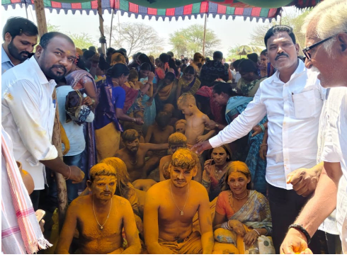
ధన్వాడ ఏప్రిల్ 22 (ప్రజా జ్యోతి)