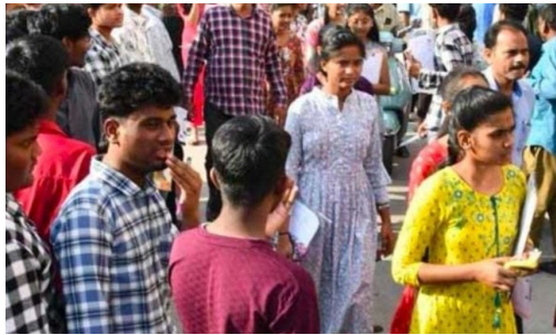
విద్యార్థులకు అవకాశం కల్పించినందుకు, ఈ చక్కటి అవకాశాన్ని విద్యార్థులు చదివినయోగం చేసుకోగలరు.

కొల్హాపూర్ నియోజకవర్గంలో ఉన్న ఐదు మండలాల గ్రామాలలో చదువుతున్న ఇంటర్మీడియట్ విద్యార్థులకు అడ్వాన్స్ డే సప్లమెంటరీ పరీక్షలను మళ్లీ రాయదానికి అవకాశం కల్పించినందుకు, ఈ చక్కటి అవకాశాన్ని విద్యార్థులు చదివినయోగం చేసుకోగలరు. తెలంగాణ ఇంటర్మీడియట్ అడ్వాన్స్ డే సప్లమెంటరీ పరీక్షలకు సంబంధించి విద్యార్థులకు మరో అవకాశం కల్పిస్తూ ఇంటర్ బోర్డు కీలక నిర్ణయం తీసుకుంది ఫీజు చెల్లించు గడువును పెంచుతూ తాజా ఉత్తర్వులు జారీ చేసింది. తెలంగాణ స్టేట్ బోర్డ్ ఆఫ్ ఇంటర్మీడియట్ ఎడ్యుకేషన్ ప్రకటించిన వివరాల ప్రకారం, అడ్వాన్స్ డే సప్లమెంటరీ పరీక్షల ఫీజు చెల్లించే గడువును ఈ నెల 23వ తేదీ వరకు పొడిగించారు. వాస్తవానికి ఈ గడువు అంతకుముందే ముగియాలి ఉన్నప్పటికీ విద్యార్థులు తల్లిదండ్రుల అభ్యర్థన మేరకు బోర్డు ఈ వెసులుబాటు కల్పించింది ప్రథమ ద్వితీయ సంవత్సరాల్లో మార్కులు తక్కువ గా వచ్చి, ఇంప్రూవ్ మెంట్ రాసుకోవాలనుకునే కూడా వీటికి దరఖాస్తు చేసుకోవచ్చు. అంతే కాకుండా పరీక్షల్లో ఉత్తీర్ణత సాధించ లేక పోయిన విద్యార్థులు తమ