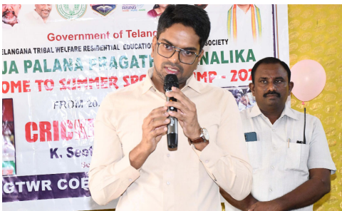
వనపర్తి జిల్లా ప్రతినిధి ఏప్రిల్ 21.

విద్యార్థుల్లో దాగి ఉన్న ప్రతిభను వెలికి తీయడానికి క్వీజ్, చిత్రలేఖనం, వ్యాసరచన పోటీలు ఎంతగానో దోహదపడతాయని, అందుకే ప్రభుత్వం ప్రజాపాలన ప్రగతి ప్రణాళిక సంక్షేమ వారోత్సవాల్లో భాగంగా విద్యార్థులకు టాలెంట్ ఫెస్ట్ నిర్వహిస్తోందని జిల్లా కలెక్టర్ ఆదర్శ్ సురభి అన్నారు. మంగళవారం జిల్లా కలెక్టర్ వనపర్తి మర్రి కుంటలోని తెలంగాణ గిరిజన సంక్షేమ గురుకుల పాఠశాలను సందర్శించారు. ప్రజాపాలన ప్రగతి ప్రణాళిక 99 రోజుల కార్యచరణ ప్రణాళికలో భాగంగా నిర్వహిస్తున్న హాకీ మరియు క్రికెట్ సమ్మర్ ట్రైనింగ్ క్యాంప్ ను ఆయన ప్రారంభించారు. ఈ సందర్భంగా కలెక్టర్ రిచ్చెన్ కల్ చేసి క్రికెట్