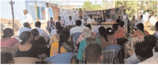
సంక్షేమ పథకాలపై అవగాహన