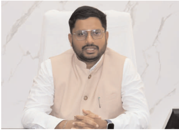
ఇటువంటి నిర్లక్ష్యం పునరావృతమైతే కఠిన చర్యలు తప్పవని కలెక్టర్ తీవ్రంగా హెచ్చరించారు.జిల్లాలో విద్యా వ్యవస్థను మరింత బలోపేతం చేయడంలో భాగంగా ప్రతి ఒక్కరూ బాధ్యతాయుతంగా వ్యవహరించాలని ఈ సందర్భంగా కలెక్టర్ ఆదేశించారు.

గద్వాల ఏప్రిల్ 02(ప్రజా జ్యోతి ప్రతినిధి):జిల్లాలోని పలు ప్రభుత్వ పాఠశాలల్లో ఎఫ్.ఆర్.ఎస్(ఫీస్ రికగ్నెజ్ సిస్టం) హాజరు విధానం సక్రమంగా నిర్వహించకపోవడం వలన 76 మంది విద్యాశాఖ సిబ్బందికి షోకాజ్ నోటీసులు జారీ చేసినట్లు జిల్లా కలెక్టర్ రిజ్వాన్ బాషా షేక్ గురువారం ఒక ప్రకటనలో తెలిపారు.గురువారం జిల్లా వ్యాప్తంగా ఉన్న అన్ని ప్రభుత్వ పాఠశాలలలో అమలువుతున్న ఫీషియల్ రికగ్నెజ్ సిస్టమ్ హాజరు నమోదుపై సమగ్రంగా పరిశీలించగా,పలుచోట్ల ఉపాధ్యాయులు,ఇతర సిబ్బంది ఎఫ్.ఆర్.ఎస్ యాప్ లో హాజరు సక్రమంగా నమోదు చేయకపోవడం గమనించారు.ఈ నేపథ్యంలోనే కలెక్టర్ జిల్లా పరిధిలోని 61పాఠశాలలకు చెందిన 76 మంది బోధన మరియు బోధనేతర సిబ్బందిపై చర్యలు తీసుకుంటూ వారికి షోకాజ్ నోటీసులు జారీ చేశామన్నారు.సంబంధిత సిబ్బంది తమ సంజాయిషీని మూడు రోజుల లోపు సమర్పించాల్సిందిగా కలెక్టర్ ఆదేశించారు.జిల్లాలోని ప్రభుత్వ పాఠశాలల ఉపాధ్యాయులు,సిబ్బంది ప్రభుత్వం నిర్దేశించిన విధి విధానాలను కచ్చితంగా పాటించడంతో పాటు,ప్రతి రోజూ ఎఫ్.ఆర్.ఎస్ ద్వారా హాజరును తప్పనిసరిగా సమయానికి నమోదు చేయాలని కలెక్టర్ స్పష్టమైన ఆదేశాలు జారీ చేశారు. భవిష్యత్తులో