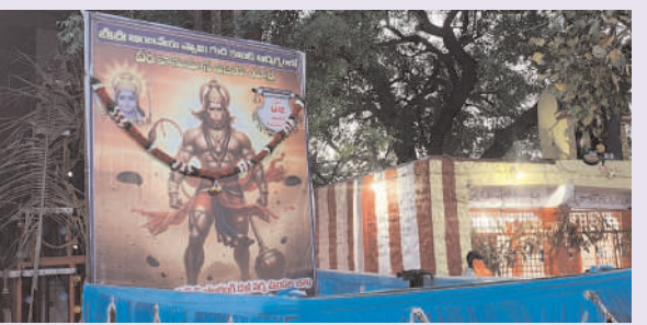
నర్స ఏప్రిల్ 02 ( ప్రజా జ్యోతి )