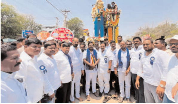
అచ్చంపేట ఏప్రిల్ 14 (ప్రజా జ్యోతి)