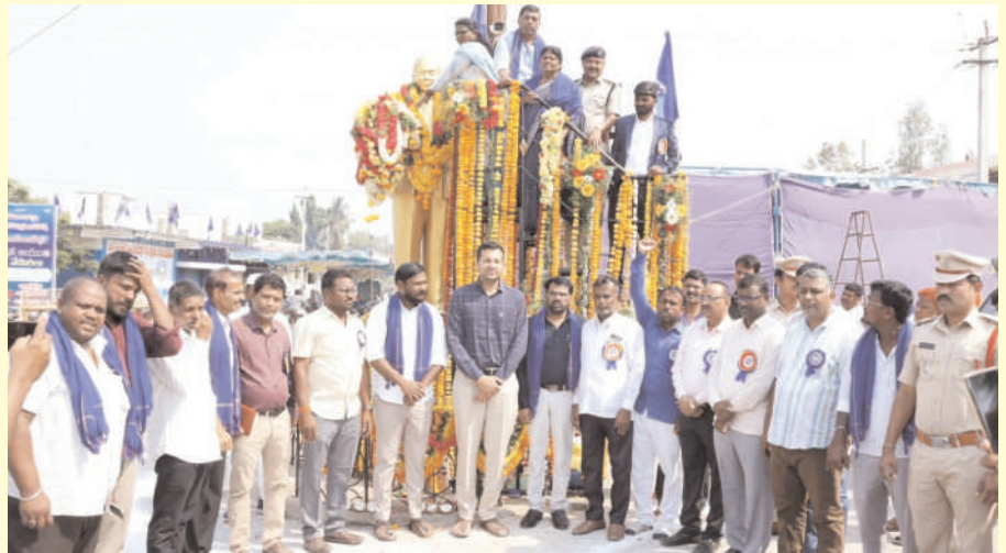
నారాయణపేట నియోజకవర్గం ప్రతినిధి ఏప్రిల్ 14 (ప్రజా జ్యోతి)