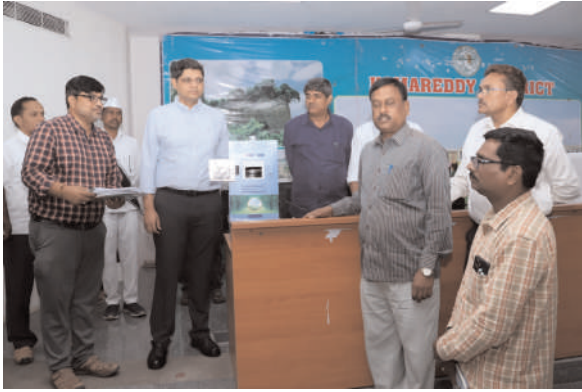
కామారెడ్డి ప్రతినది ఏప్రిల్ 13.