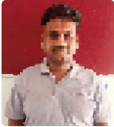
స్టేబుల్ లేదా హోంగార్డ్ ఉద్యోగాలు ఇప్పిస్తానని వారిని నమ్మించారు.

ఉద్యోగాలు ఇప్పిస్తానని 5 లక్షల రూపాయల వసూలు.