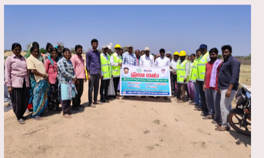
ముర్రాపూర్ లో విద్యుత్ సమస్యల పరిష్కారానికి