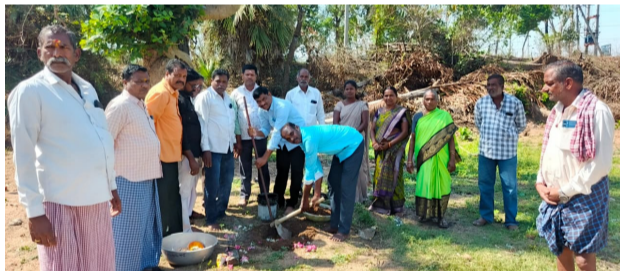
పదిరెండు గుడికి 75 వేల విరాళం...