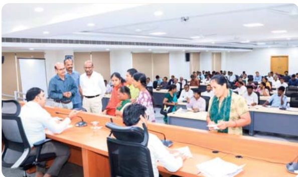
అర్జీదారుల సమస్యల గురించి తెలుసుకుంటూ తగిన చర్యలు తీసుకోవాలని అధికారులను ఆదేశించారు. ఈ సందర్భంగా 286 అర్జీలను కలెక్టర్