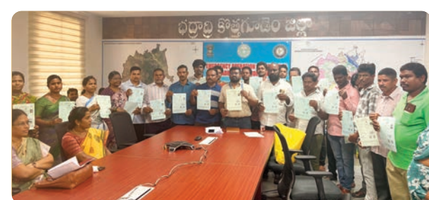
అనంతరం వారికి రిజిస్ట్రేషన్ పత్రాలు అందజేశారు.