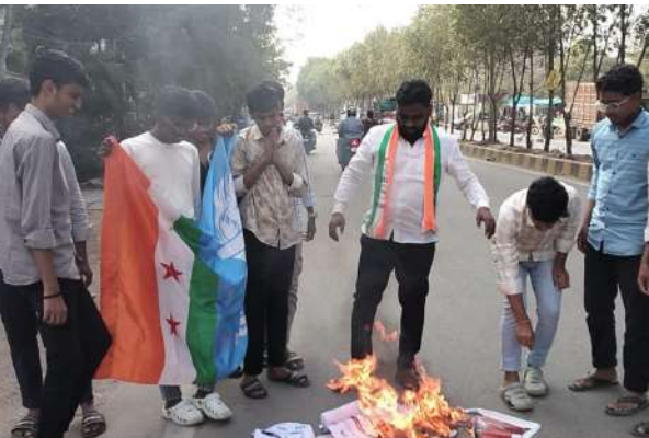
కూకట్ పల్లి, ఏప్రిల్ 17 (ప్రజా జ్యోతి) : బిజెపి ఎంపీ తేజస్వి సూర్య ప్రార్థన

- 60 ఏళ్ల తెలంగాణ పోరాటం గురించి తెలుసుకో - తెలంగాణ రాష్ట్ర ఎదుగుదలను బిజెపి పాలకులు ఓర్వలేక పోతున్నారు - బీజేపీ ఎంపీ తేజస్వి సూర్య పై మండి పడతే తెలంగాణ ఎన్ ఎన్ యు ఐ విదార్థి నాయకులు