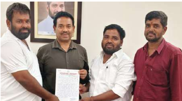
మొయినాబాద్, ఏప్రిల్ 17 (ప్రజా జ్యోతి) మొయినాబాద్ మున్సిపాలిటీ పరిధిలోని సురంగల్ 14వ వార్డులో ప్రజలను భయాందోళనకు గురిచేస్తున్న విద్యుత్ తీగల సమస్యకు త్వరలో పరిష్కారం లభించే పరిస్థితులు ఏర్పడ్డాయి. వార్డులో పాతబడి వేలాడుతున్న