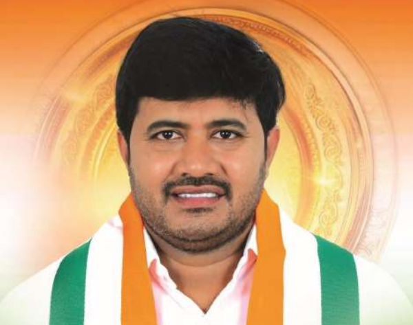
బడ్డెట్ లో సరైన నిధులు కేటాయించకుండా దక్షిణాది రాష్ట్రాలను నిర్లక్ష్యం చేస్తున్న బీజేపీ, ఇప్పుడు ఇలాంటి వ్యాఖ్యలతో మరింత అవమానానికి పాల్పడుతోంది. దీనిపై బీజేపీ కేంద్ర నాయకత్వం నుంచి స్థానిక నాయకుల వరకు ప్రతి ఒక్కరూ బేసరతుగా క్షమాపణ చెప్పాలి. గత పన్నెండు సంవత్సరాలుగా దక్షిణాది రాష్ట్రాలకు జరుగుతున్న అన్యాయానికి ప్రజలు గట్టి గుణపాఠం చెప్పే రోజు దగ్గరలోనే ఉంది. దక్షిణాది రాష్ట్రాల హక్కులను కాపాడుకోవడం కోసం మేము సిద్ధంగా ఉన్నాం. బీజేపీ వెంటనే తన వైఖరిని మార్చుకుని క్షమాపణ చెప్పాలి, లేదంటే ప్రజల తీర్పు తీవ్రంగా ఉంటుంది.

కూకట్ పల్లి, ఏప్రిల్ 17 (ప్రజా జ్యోతి): డీలిమిటేషన్ బిల్లు చట్టసభలకు వచ్చిన ఈ కీలక సమయంలో దక్షిణాది రాష్ట్రాలకు చెందిన ఎంపీలు, అధికార పార్టీలు, ప్రతిపక్ష పార్టీలు అన్నీ కలిసి మన హక్కుల కోసం ముక్తకంఠం పోరాడాల్సిన అత్యవసర పరిస్థితి ఏర్పడింది. రేచంత్ రెడ్డి ఇప్పటికే తన అభిప్రాయాన్ని స్పష్టంగా చెబుతున్నాడు. అలాగే ఎం.కె. స్థాలిన్, పినరాయ విజయన్ కూడా దక్షిణాది రాష్ట్రాలకు జరుగుతున్న అన్యాయాన్ని గట్టిగా ప్రశ్నించారు. ఈ రోజు మీరు ప్రశ్నించకపోతే, రేపు దక్షిణాది రాష్ట్రాలకు జరిగే అన్యాయానికి మీరు కూడా బాధ్యత వహించాల్సి ఉంటుంది. ఇది కేవలం రాజకీయ అంశం కాదు -- భవిష్యత్తులో మన రాష్ట్రాల అభివృద్ధి, హక్కులు, న్యాయం అన్నీ ప్రమాదంలో పడే పరిస్థితి. బీఆర్ఎస్, స్థానిక బీజేపీ, టీడీపీ, జనసేన, వైఎస్ఆర్ కాంగ్రెస్ పార్టీ నాయకులు రాజకీయాలను పక్కన పెట్టి దక్షిణాది హక్కుల కోసం ఐక్యంగా పోరాడాల్సిన సమయం ఇది. తెలంగాణ రాష్ట్రం వేలాది అమర వీరుల త్యాగాల ఫలితం. సోనియా గాంధీ ప్రజల భావోద్వేగాన్ని గౌరవించి తెలంగాణ రాష్ట్ర ఏర్పాటుకు మార్గం సుగమం చేశారు. అలాగే సుష్మా స్వరాజ్ కూడా తెలంగాణ ఏర్పాటుకు మద్దతు ఇచ్చిన విషయం అందరికీ తెలిసిందే. అలాంటి పవిత్రమైన రాష్ట్రాలను అవమానించేలా బీజేపీకి చెందిన కొందరు నాయకులు మాట్లాడటం తీవ్రంగా ఖండించాల్సిన విషయం. తెలంగాణ, ఆంధ్ర రాష్ట్రాలను పాకిస్తాన్ తో పోల్చడం తెలుగు ప్రజలను అవమానపరచటమే. ఇది రెండు రాష్ట్రాల ప్రజల గౌరవాన్ని దెబ్బతీసే చర్య. బీజేపీ ఇప్పటికే విభజన హామీలను అమలు చేయకుండా,