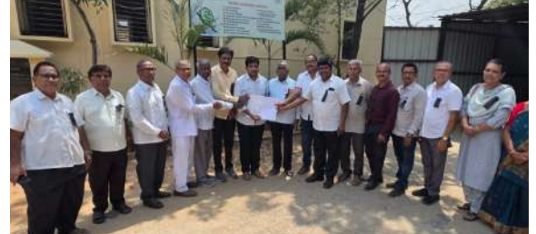
కూకట్పల్లి, ఏప్రిల్ 17 (ప్రజా జ్యోతి): టీజేఐపీసీ పిలుపుమేరకు కూకట్పల్లి మండల జేపీసీ ఆధ్వర్యంలో ఉపాధ్యాయులు ఈ

- డిప్యూటీ తహసీల్దార్ కి వినతి పత్రం అందించిన ఉపాధ్యాయులు