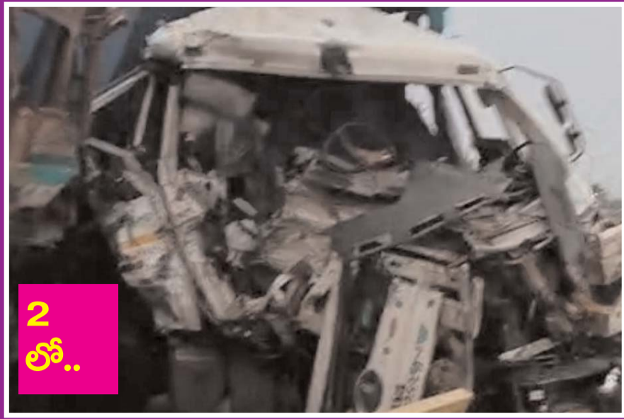
ఎదురెదురుగా ఢీకొన్న ఇసుక లారీ, టిప్పర్