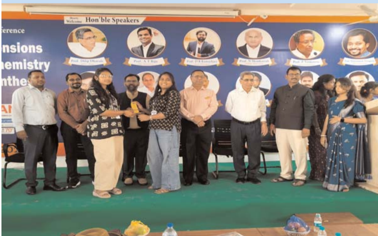
పరిశోధనా పత్రాలకు బహుమతులు అందజేశారు. కార్యక్రమంలో అధ్యాపకులు, విద్యార్థులు పాల్గొన్నారు.

సదస్సులో వివిధ యూనివర్సిటీల ప్రొఫెసర్లు ఔషధ తయారీ రంగంలోని తాజా పరిశోధనలను వివరించారు. విద్యార్థుల పేపర్ ప్రజంటేషన్లు ప్రత్యేక ఆకర్షణగా నిలిచాయి. ఉత్తమ