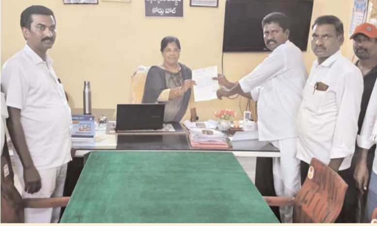
మునగాల ఏప్రిల్ 28 ప్రజా జ్యోతి