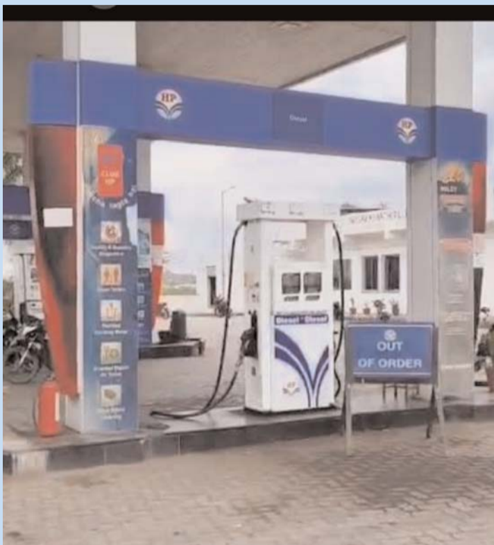
మునుగోడు, ఏప్రిల్, 28, (ప్రజా జ్యోతి )

మునుగోడు మండల పరిధిలోని పెట్రోల్ బంక్ ఆకస్మికశీగా రెండు నుండి పెట్రోల్ బంకులు బంద్ కావడంతో ప్రజలు తీవ్ర ఇబ్బందులు ఎదుర్కొంటున్నారు ముఖ్యంగా వాహనాలు దారులు ఇంధనం కోసం వేరే గ్రామాలకు వెళ్ళవలసిన పరిస్థితి ఏర్పడుతుంది ఉద్యోగులు రైతులు విద్యార్థులు రాకపోకలు కు ఇబ్బందులు పడుతున్నారు అత్యవసర సేవలకు కూడా ఆటంకం కలుగుతుంది ది ఇదే అదునుగా చూసుకోని కొంతమంది దళారులు 50 లీటర్ల క్యాన్లలో స్టాక్ పోయించుకుని అధిక మొత్తంలో వాహనదారుల నుండి వసూళ్ళకు పాల్పడుతున్నారు బంకు లు బంధు గల కారణాలు ఇంకా స్పష్టంగా తెలవకపోవడంతో ప్రజలు అధికారులు వెంటనే స్పందించి సమస్యను పరిష్కరించాలని గ్రామస్తులు వాహనదారులు కోరుకుంటున్నారు.