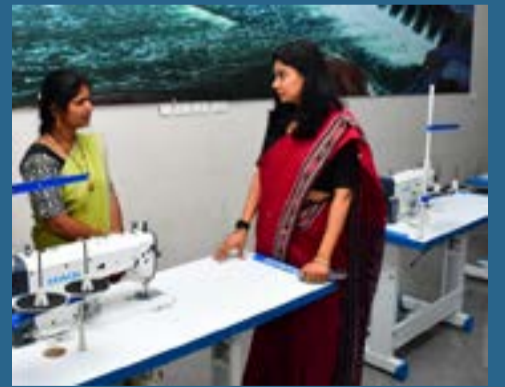
రాజన్న సిరిసిల్ల ప్రతినిధి ఏప్రిల్ -27 (ప్రజాజ్యోతి)

జిల్లా అధికార యంత్రాంగం ఆధ్వర్యంలో అందజేసిన కుట్టు మిషన్లను మహిళలు సద్వినియోగం చేసుకొని.. ఉపాధి పొందుతూ ఆర్థికంగా ఎదగాలని జిల్లా కలెక్టర్ గరిమ అగ్రవాల్ ఆకాంక్షించారు.