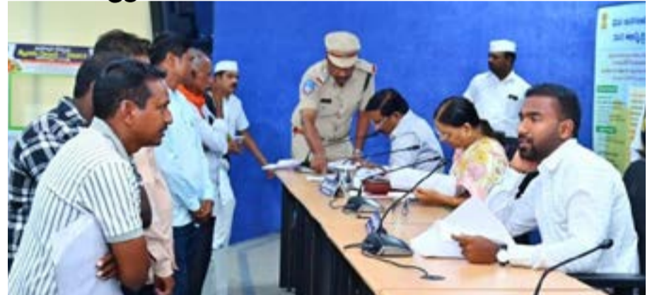
జగిత్యాల, ఏప్రిల్ 27 (ప్రజాజ్యోతి):