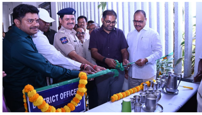
సంక్షేమ శాఖ అధ్యక్షులలో ఏర్పాటు చేసిన *మిషన్ వాత్సల్య బాలల పరిరక్షణ సేవలు* స్టాల్ ను కలెక్టర్ ప్రారంభించారు. బాలల హక్కుల రక్షణ, అనాథ పిల్లల సంరక్షణ కోసం ప్రభుత్వం అందిస్తున్నాను.