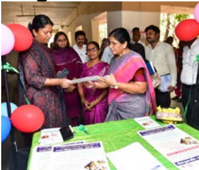
కలీంనగర్ బ్యూరో, ఏప్రిల్ 27 (ప్రజాజ్యోతి)