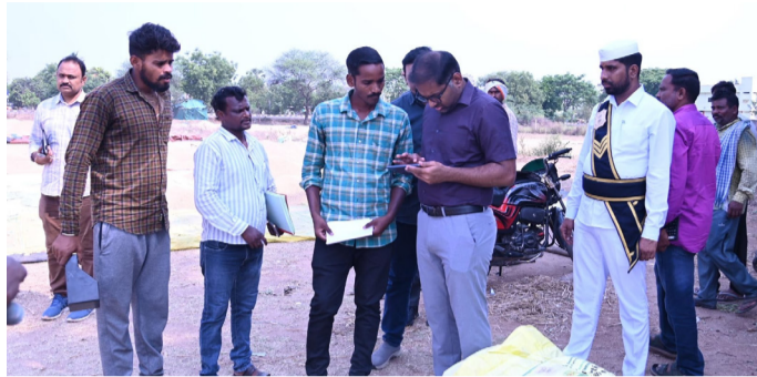
ఎఫ్ఎక్యూ (ఫియర్ అవరేజ్ క్వాలిటీ) ప్రమాణాలకు అనుగుణంగా ఉండేలా చూసుకోవాలని తెలిపారు. తూకం, తేమ