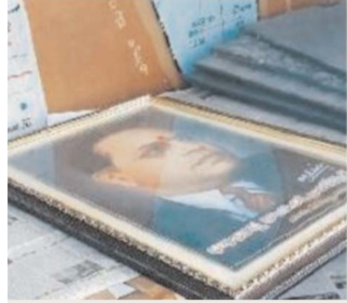
అధికారులు నిర్లక్ష్యంగా మూలకు పడవేయడంపై ఆసరా

: భారత రాజ్యాంగ నిర్మాత: డాక్టర్ బి.ఆర్ అంబేద్కర్ చిత్రపటాన్ని నార్కట్ పల్లి తహసీల్దార్ కార్యాలయంలో