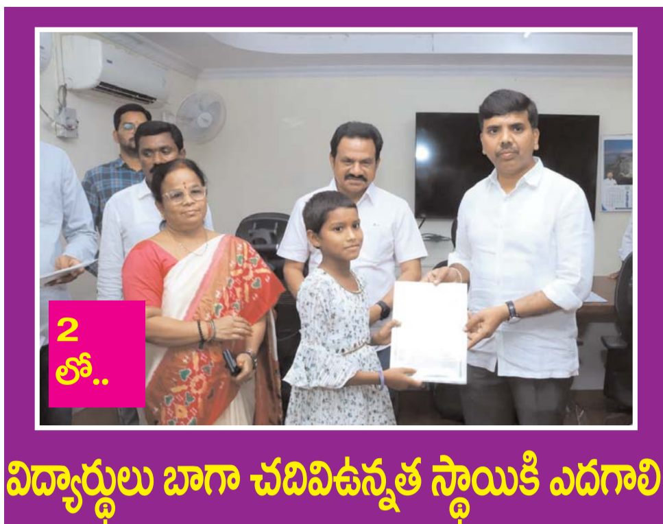
విద్యార్థులు బాగా చదివిఉన్నత స్థాయికి ఎదగాలి