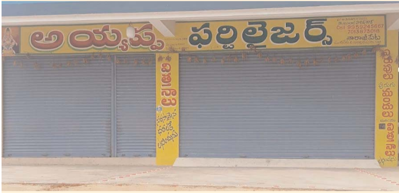
ఆలేరు, ఏప్రిల్ 27 (ప్రజా జ్యోతి)

రాష్ట్ర ఎరువుల డీలర్ల యూనియన్ పిలుపు మేరకు సోమవారం ఆలేరు మండల కేంద్రంలో ఎరువుల దుకాణాల బండ్ సంపూర్ణంగా జరిగింది. ఎరువుల వ్యాపారులు ఎదుర్కొంటున్న దీర్ఘకాలిక సమస్యల పరిష్కారం కోసం మరియు ప్రభుత్వం, కంపెనీల మొండి వైఖరిని నిరసిస్తూ డీలర్లందరూ స్వచ్ఛందంగా తమ షాపులను మూసివేసి నిరసన వ్యక్తం చేశారు.