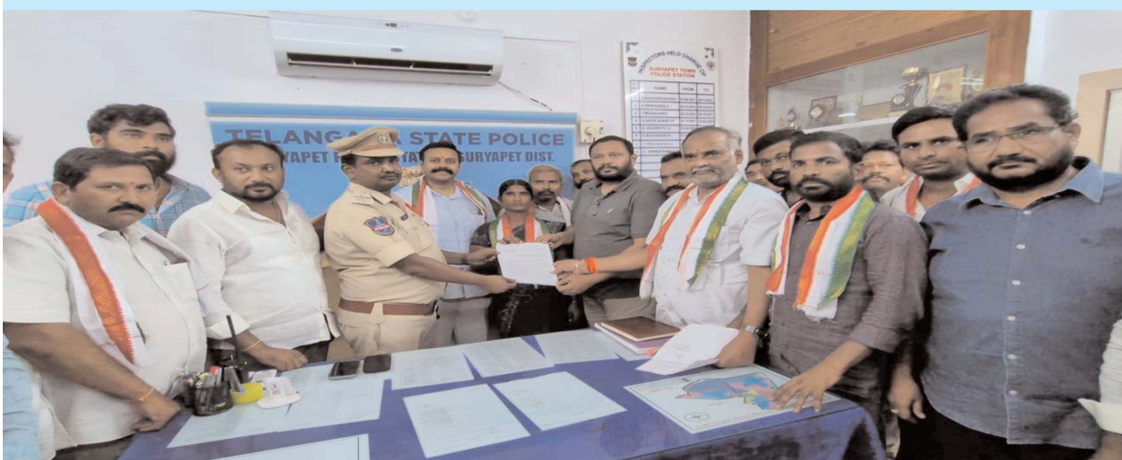
సూర్యాపేట జిల్లా ప్రతినిధి ఏప్రిల్ 27(ప్రజాజ్యోతి)