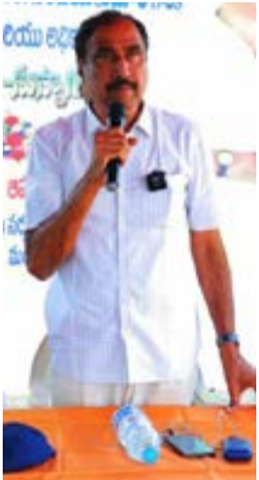
బీర్ పూర్, ఏప్రిల్ 25 (ప్రజా జ్యోతి):