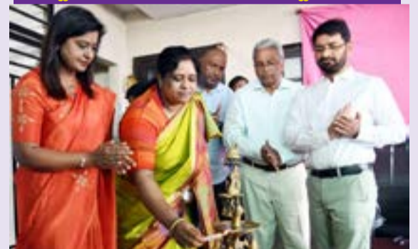
కలీంగర్ టౌన్ ఏప్రిల్ 25 (ప్రజా జ్యోతి)