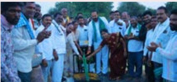
సుల్తానాబాద్, ఏప్రిల్ 25 (ప్రజా జ్యోతి)

కొనుగోలు కేంద్రాలను సద్వినియోగం చేసుకోవాలి ప్రభుత్వ విప్ ఎమ్మెల్యే విజయరమణారావు