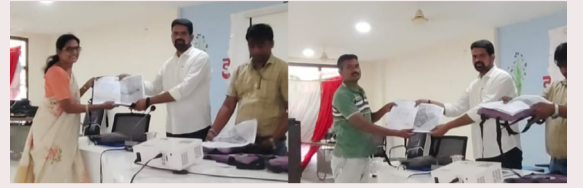
జనగణన 20 27 సూపర్ వైజర్లు ఎన్యూమరేటర్లు బాధ్యతాయుతంగా జన గణన పూర్తి చేయాలి

చేసుకుని ఆశీర్వాదాలు పొందారు. మహిళలు మంగళహారతులు పట్టి, భక్తి గీతాలతో కార్యక్రమాన్ని మరింత శోభాయమానం చేశారు. గరుడ స్తంభం ప్రతిష్ఠాపనతో అలయానికి మరింత మహిమాన్వితత చేకూరిందని భక్తులు ఆనందం వ్యక్తం చేశారు. ఈ వేడుకలో స్థానిక ప్రముఖులు, అలయ కమిటీ సభ్యులు, గ్రామ పెద్దలు పాల్గొని కార్యక్రమాన్ని విజయవంతం చేశారు. మొత్తానికి ఈ గరుడ స్తంభం స్థాపన మహోత్సవం ముస్తాబాద్ ప్రాంతంలో ఒక ఆధ్యాత్మిక పండుగలా సాగి భక్తుల మనసులను హత్తుకుంది.