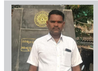
బీజేపీ ఎస్సీ దళిత మోర్చా వీణవంక మండల అధ్యక్షుడిగా