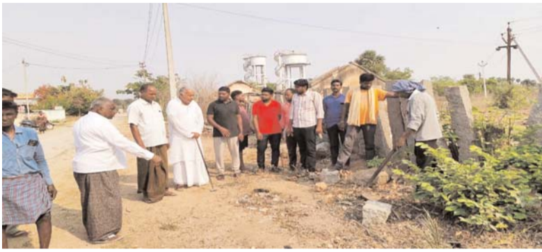
మునగాల, ఏప్రిల్ 22 (ప్రజా జ్యోతి):