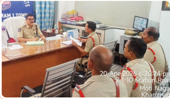
20-Apr-2026 6:20:24 pm 2-1-10 Station Road Moti Nagar Khammam