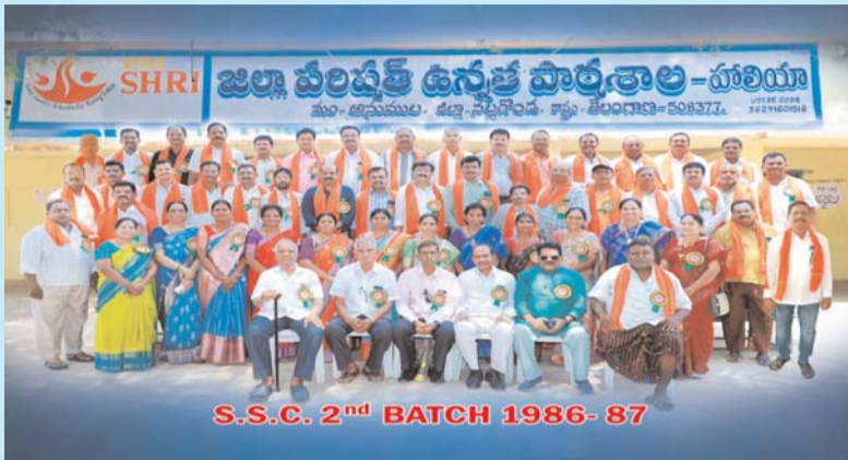
S.S.C. 2 nd BATCH 1986-87

అనుముల మండలం, హాలియా పట్టణం లోని జిల్లా పరిషత్ ఉన్నత పాఠశాలలో 10వ తరగతి 1986-87 సంవత్సరపు పూర్వ విద్యార్థులు ఆత్మీయ సమ్మేళనం ఆదివారం ఘనంగా జరుపుకున్నారు. 40 సంవత్సరాల తర్వాత విద్యార్థులందరూ తమ తమ స్నేహితులను కలుసుకొని ఒకరినొకరు ఆత్మీయంగా పలకరించుకున్నారు. ఆనాటి అల్లరిని గుర్తు చేసుకున్నారు. యోగక్షేమాలు అడిగి తెలుసుకుని బాల్యపు స్మృతులను నెమరు వేసుకున్నారు. చిన్ననాటి జ్ఞాపకాలను గుర్తు తెచ్చుకున్నారు. అలనాటి మధురస్మృతులను తలచుకొని భావోద్వేగానికి గురయ్యారు. సరదగా ఆటలు ఆడారు. సాంస్కృతిక కార్యక్రమాలు నిర్వహించుకున్నారు. తమకు విద్యాబుద్ధులు నేర్పించి, అక్షర జ్ఞానంతో తమ భవిష్యత్తులను వేసిన గురువులను గొప్పగా సన్మానించి, గురువులపై తమ గౌరవాన్ని చాటుకున్నారు. ఎంతో విధేయతతో గొప్ప మనసు కలిగి ఉన్నత శిఖరాలను చేరిన తమ తమ విద్యార్థులను చూసి గురువుల కళ్ళు ఆనంద భాషాలు వర్షించాయి. తమ కళ్ళముందే చిన్న మొక్కలు వంటి విద్యార్థులు పెరిగి పెద్దయి వున్నాల్సినా ఇలా ముందట కనిపిస్తుంటే మనసు నిండిపోయిందని, ఇంతకన్నా మాకేం కావాలని, మా జీవితం ధన్యమైందని, గురువులంతా ముక్తకంఠంతో, ఆనందం వ్యక్తపరిచారు. తమ గురువులను సత్కరించుకున్న విద్యార్థులు రోజంతా ఎంతో సంతోషంగా గడిపారు. తాము చదువుకున్న పాఠశాలకు రూ. 25000 రూపాయలతో మొబైల్ మైక్ సెట్ ను