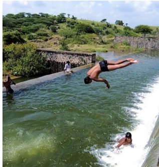
ఉండటం, అడుగున రాళ్లు ఉండటం వల్ల ప్రమాదాలు అధికంగా జరుగుతున్నాయి.

వేసవి వేడిని తట్టుకోలేక గ్రామీణ, పట్టణ ప్రాంతాల పిల్లలు చెరువులు, బావులు, కుంటల వద్దకు వెళ్లడం సాధారణమైంది. అయితే తల్లిదండ్రులకు చెప్పకుండా స్నేహితులతో వెళ్లడం వల్ల ప్రమాదాలు మరింత పెరుగుతున్నాయి. ఈ రాని పిల్లలను స్నేహితులు ప్రోత్సహించడం, బావుల్లో దూకిన తర్వాత రక్షించలేకపోవడం వంటి పరిస్థితులు విషాదాలకు దారితీస్తున్నాయి. ఈ రాని పిల్లలను నీటి వనరుల వద్దకు పంపకూడదని, అవసరమైతే పెద్దల పర్యవేక్షణలోనే ఈత నేర్పాలని పేర్కొంటున్నారు. ఈతలో ప్రమాదాలకు ప్రధాన కారణాలు: పిల్లలకు నీటి వనరులపై సరైన అవగాహన లేకపోవడం, లోతు అంచనా వేయలేకపోవడం, సరదాగా పోటీలు పెట్టుకోవడం, పైనుంచి తలకిందులుగా దూకడం వంటి చర్యలు ప్రమాదాలకు దారితీస్తున్నాయి. ముఖ్యంగా క్వారీ గుంతలు, ప్రాజెక్టుల వద్ద నీటి లోతు ఎక్కువగా