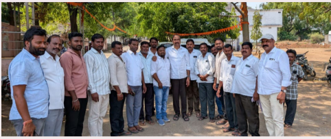
నన్ను ఉప సర్పంచ్ పోరం అధ్యక్షులు గా ఎన్నుకున్న నాతోటి ఉప సర్పంచ్ కు కృతజ్ఞతలు

మారుస్తానని ఆయన ప్రజలకు హామీ ఇచ్చారు. మున్సిపల్ కా ర్యాలయానికే పరిమితం కాకుండా ప్రతిరోజు వార్డుల్లో పర్యటిస్తూ ప్రజా సమస్యలపరిష్కారమే లక్ష్యంగా సామాన్య ప్రజలకు అందుబాటులో ఉంటున్న చైర్మన్ పర్యటనలు ప్రజలను ఆకట్టుకుంటున్నాయి. మున్సిపల్ అధికారులను సమన్వయం చేసుకుంటూ పనులలో వేగం పెంచడమే కాకుండా అభివృద్ధి విషయంలో రాజీవేని ధోరణితో ముందుకు సాగుతున్న ఆయన పనితీరు పై స్థానికులు హర్షం వ్యక్తం చేస్తున్నారు. ఈ కార్యక్రమంలో ఏఈ అసన్యతో పాటు మున్సిపల్ అధికారులు మరియు పాఠశాల ధ్య కార్యకులు పాల్గొన్నారు.