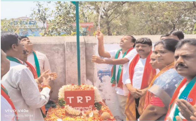
సిద్ధంగా ఉందని తెలంగాణ రాజ్యాధికార పార్టీ వ్యవస్థాపకులు

గ్రామ గ్రామాన తెలంగాణ రాజ్యాధికార పార్టీ జెండాను ఎగరవేస్తామని 2029లో ఆలేరులో అసెంబ్లీ స్థానం గెలవడానికి