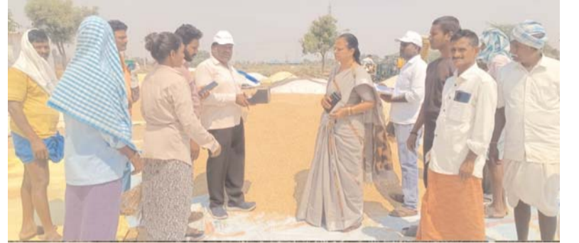
మునుగోడు, ఏప్రిల్, 15, (ప్రజా జ్యోతి)