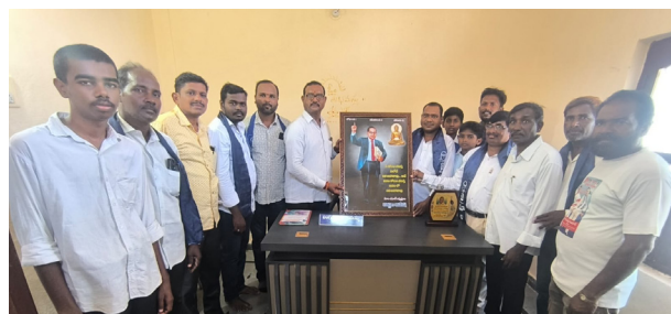
గ్రామపంచాయతీకి అంబేద్కర్ చిత్రపటం బహుకరణ