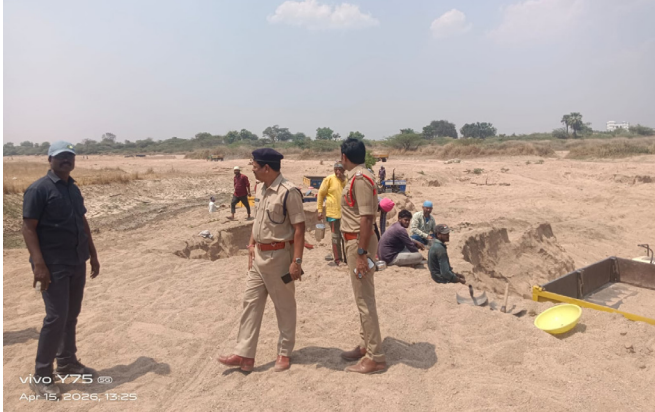
నిసరిగా అనుసరించాలని ఆయన స్పష్టం చేశారు.