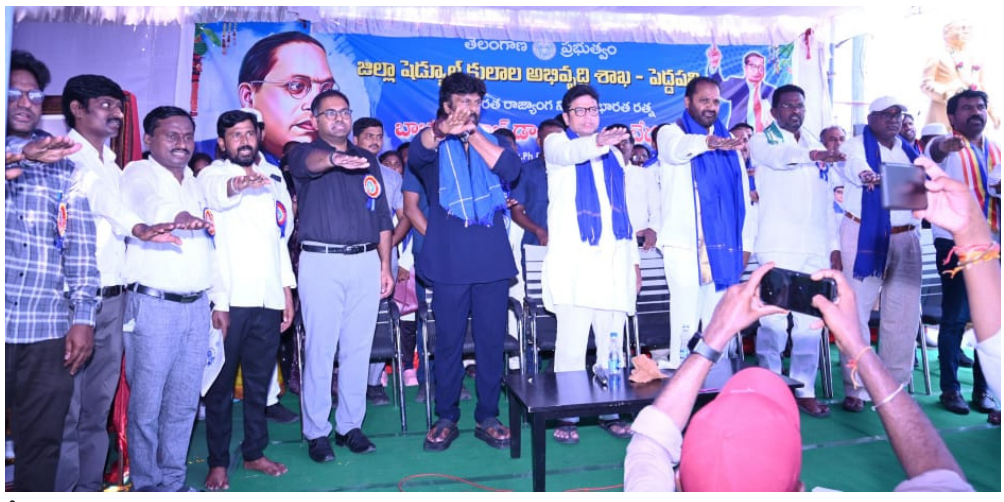
పల్లవల్లి, ప్రతినాథి ఏప్రిల్-14 ప్రజాజ్యోతి: