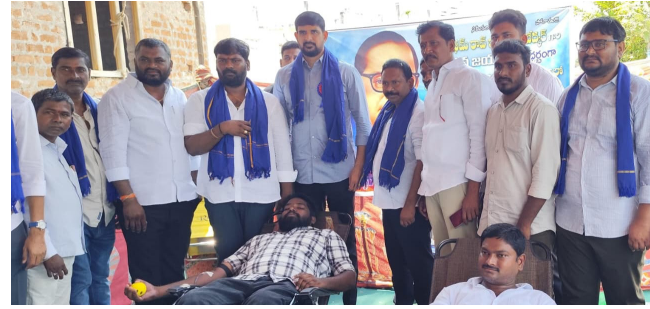
అంబేద్కర్ జయంతి సందర్భంగా రక్తదాన శిబిరం