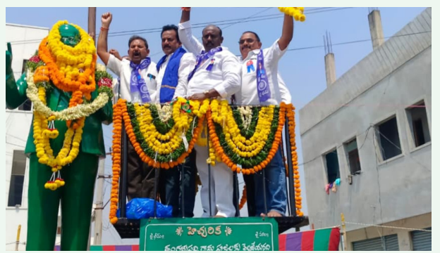
తంగళ్ళపల్లి మండల కేంద్రంలో ఘనంగా డాక్టర్ బి.ఆర్ అంబేద్కర్ 135వ జయంతి ఉత్సవాలు