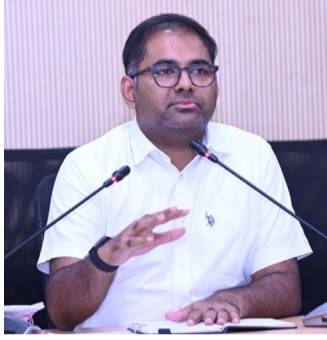
నైపుణ్య శిక్షణ కేంద్రాన్ని ప్రారంభించు నున్నట్లు తెలిపారు.*

పెద్దపల్లి ప్రతినిధి, ఏప్రిల్ - 13 ప్రజా జ్యోతి: మహిళలు స్వయం శక్తితో ఎదిగి పారిశ్రామికవేత్తలుగా రాణించేలా ప్రోత్సహించేందుకు తెలంగాణ ప్రభుత్వం కీలక చర్యలు చేపడుతోందిని *జిల్లా కలెక్టర్ కోయ శ్రీహర్ష* సోమవారం ఒక ప్రకటనలో తెలిపారు. ఈ సందర్భంలో *ఏప్రిల్ 14న ఉదయం గం.1100లకు ఐటీ, ఎలక్ట్రానిక్స్ & కమ్యూనికేషన్స్, పరిశ్రమలు, వాణిజ్యం శాసనసభా వ్యవహారాల శాఖ మంత్రి శ్రీ దుద్దిల్ల శ్రీధర్ బాబు 'వీ హబ్ (WE HUB) మహిళా