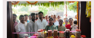
జనరల్ స్టోర్ నీ ప్రారంభించిన

రు 93.26, ప్రథమ సంవత్సరం 83 మంది విద్యార్థులు హాజరుకాగా, 70 మంది ఉత్తీర్ణులయ్యారు 84.34 *స్త్రిస్పౌల్ మరియు అధ్యాపక బృందం హర్షం* కళాశాల ప్రిన్సిపాల్ మరియు అధ్యాపక బృందం విద్యార్థులను, వారి తల్లిదండ్రులను ప్రత్యేకంగా అభినందించారు. ప్రభుత్వ కళాశాలల్లో నాణ్యమైన విద్య, అనుభవజ్ఞులైన అధ్యాపకుల బోధన అందుతుందనడానికి ఈ ఫలితాలే నిదర్శనమని వారు పేర్కొన్నారు. ప్రస్తుత విజయాల ఉత్సాహంతో 202627 విద్యా సంవత్సరానికి అడ్మిషన్లు ప్రారంభమైస్తున్న ప్రిన్సిపాల్ తెలియజేశారు. ఆసక్తిగల విద్యార్థులు ఈ అవకాశాన్ని సద్వినియోగం చేసుకోవాలని కోరారు.