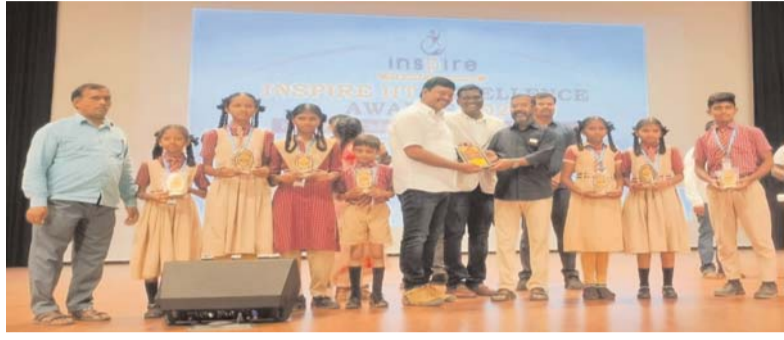
నూతనకల్.. ఏప్రిల్ 12 (ప్రజాజ్యోతి):