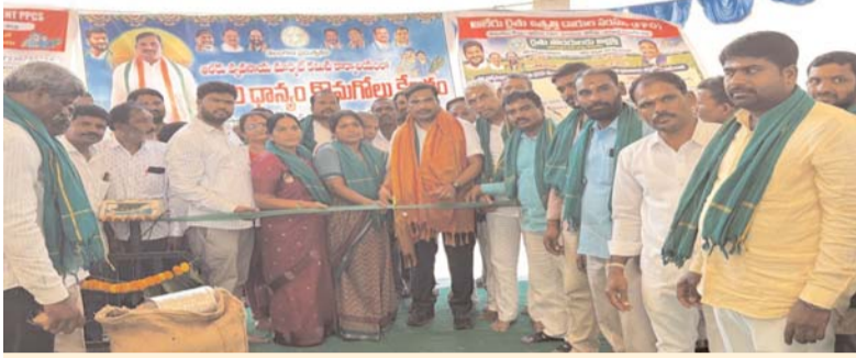
ఆలేరు ఏప్రిల్ 12 ప్రజా జ్యోతి

ఆలేరు ఎమ్మెల్యే ప్రభుత్వ విప్ బీర్ల ఐలయ్య