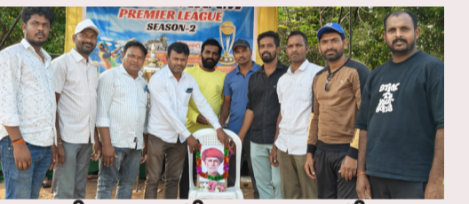
నందిమేడారంలో మహాత్మా జ్యోతిబా పూలే జయంతి వేడుకలు