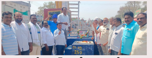
ఘనంగా జ్యోతిరావ్ పూలే జయంతి వేడుకలు