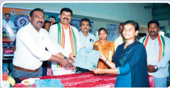
మణుగూరు, ఏప్రిల్ 09, (ప్రజాజ్యోతి) : ప్రజాపాలన 99 రోజుల ప్రగతి ప్రణాళిక కార్యక్రమంలో భాగంగా గురువారం మండల పరిధిలోని గవర్నమెంట్ ఐటీఐ, ఏటీసీలో విద్యార్థులకు మిగతా 2 లో... >