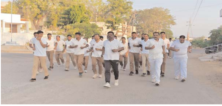
నాగార్జునసాగర్, ఏప్రిల్ 7 ప్రజా జ్యోతి