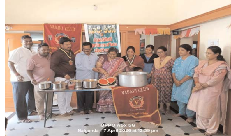
OPPO A5x 5G Nalgonda 7 April 2026 at 12:59 pm