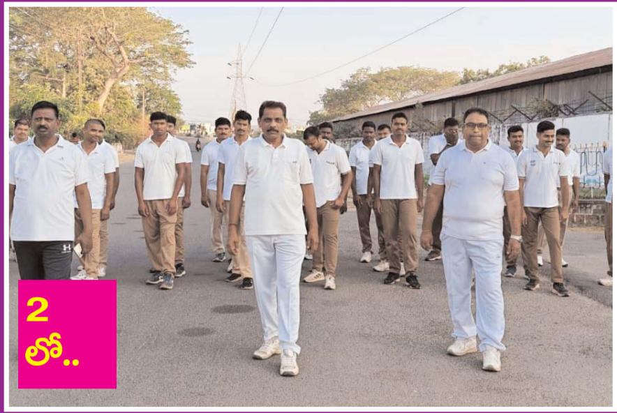
ఎస్ పి ఎఫ్ ఆధ్వర్యంలో 5 కె రన్