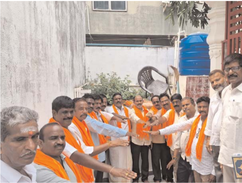
కోదాడ టౌన్, ఏప్రిల్ 05 (ప్రజా జ్యోతి):