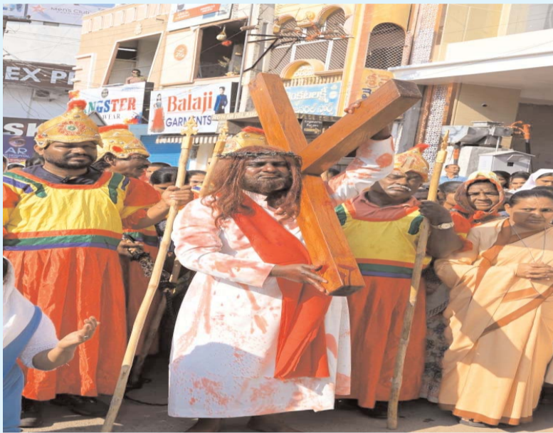
కతోలిక విశ్వాసులు, తదితరులు పాల్గొన్నారు.