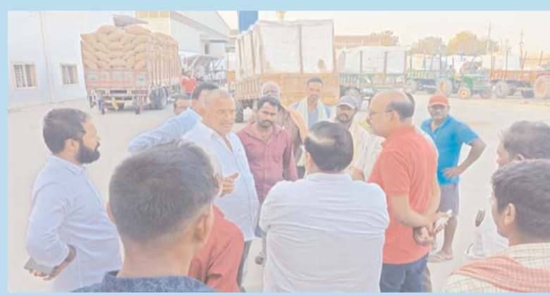
నాయక్, కాంగ్రెస్ నాయకులు, బిఎల్ఆర్ బ్రదర్స్ ఉన్నారు.