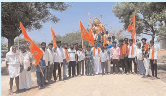
నాంపల్లి, ఏప్రిల్, 02 (ప్రజా జ్యోతి)

:హనుమాన్ జయంతి సందర్భంగా మండలంలోని మల్లపూరాజుపల్లి గ్రామంలో సీతారామాంజనేయ స్వామి దేవాలయంలో హిందూవాహిని ఆధ్వర్యంలో భక్తి, శ్రద్ధలతో ఘనంగా జయంతి వేడుకలు నిర్వహించారు. ఆంజనేయ స్వామి మూల విరాట్ కి పంచామృతాభిషేకం చేశారు, అనంతరం ఉత్సవ విగ్రహానికి ప్రత్యేక పూజలు నిర్వహించి తీర్థ ప్రసాదాలు పంపిణీ చేశారు. అనంతరం డిజై హనుమాన్, శ్రీరాముని భక్తి పాటలతో మల్లపూరాజుపల్లి పుర విధులలో శోభయాత్ర నిర్వహించారు. ఈ కార్యక్రమంలో గ్రామ పెద్దలు యువకులు, మహిళలు పెద్దఎత్తున పాల్గొన్నారు.