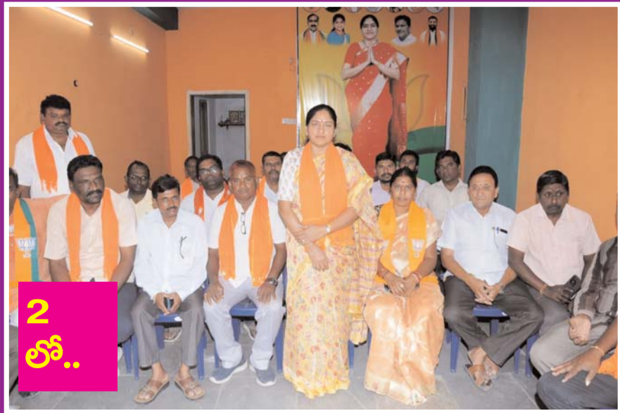
కోదాడలో బీజేపీ బలోపేతమే లక్ష్యం