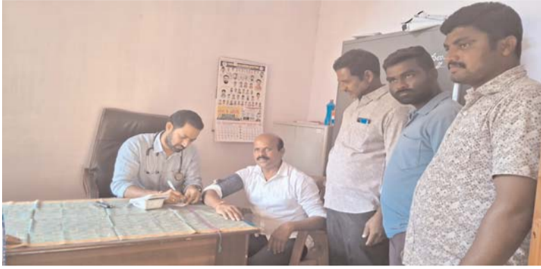
ఆలేరు ఏప్రిల్ 2 ప్రజా జ్యోతి